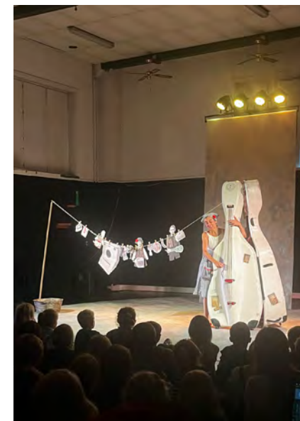
Scene fra “Vai Via”.