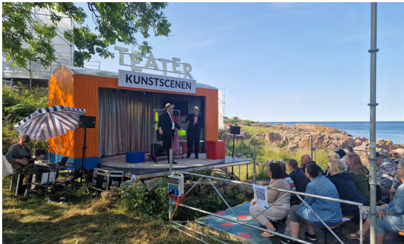
“Danish Clown” på Folkemødet i Allinge.

‘Danish Clown’ var en satirisk, tempofyldt og moderne gen-digtning af Ludvig Holbergs ‘Den Politiske Kandestøber’, men scenen var ikke på Rønne Theater, som det plejede at være, men derimod på ladet af en omrejsende teatervogn, specialbygget til formålet.