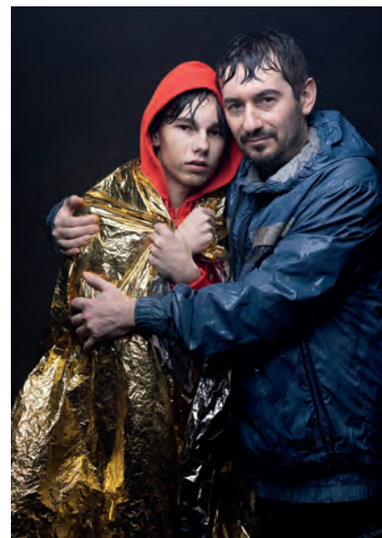
“1.Kapitel - Pelle Erobreren”.