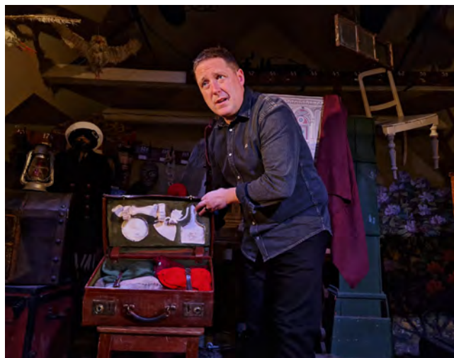
Scene fra "Teaternissens kuffert" © Michael Brøndum, Bornholms Teater

Udgifter på kr. 340.033 til selve konstruktionen af teatervognen indgår ikke i ovenstående regnskab; det vil sige at indkøbet af en trailer til understellet og stålkonstruktionen til teatervognen er bogført under anlægsaktiver. Desuden er et tilskud fra LAG-Bornholm (EU-midler) på kr. 200.000 til konstruktionen af teatervognen også posteret under anlægsaktiver, hvilket resulterer i afskrivninger af teatervognen i 2025-27.