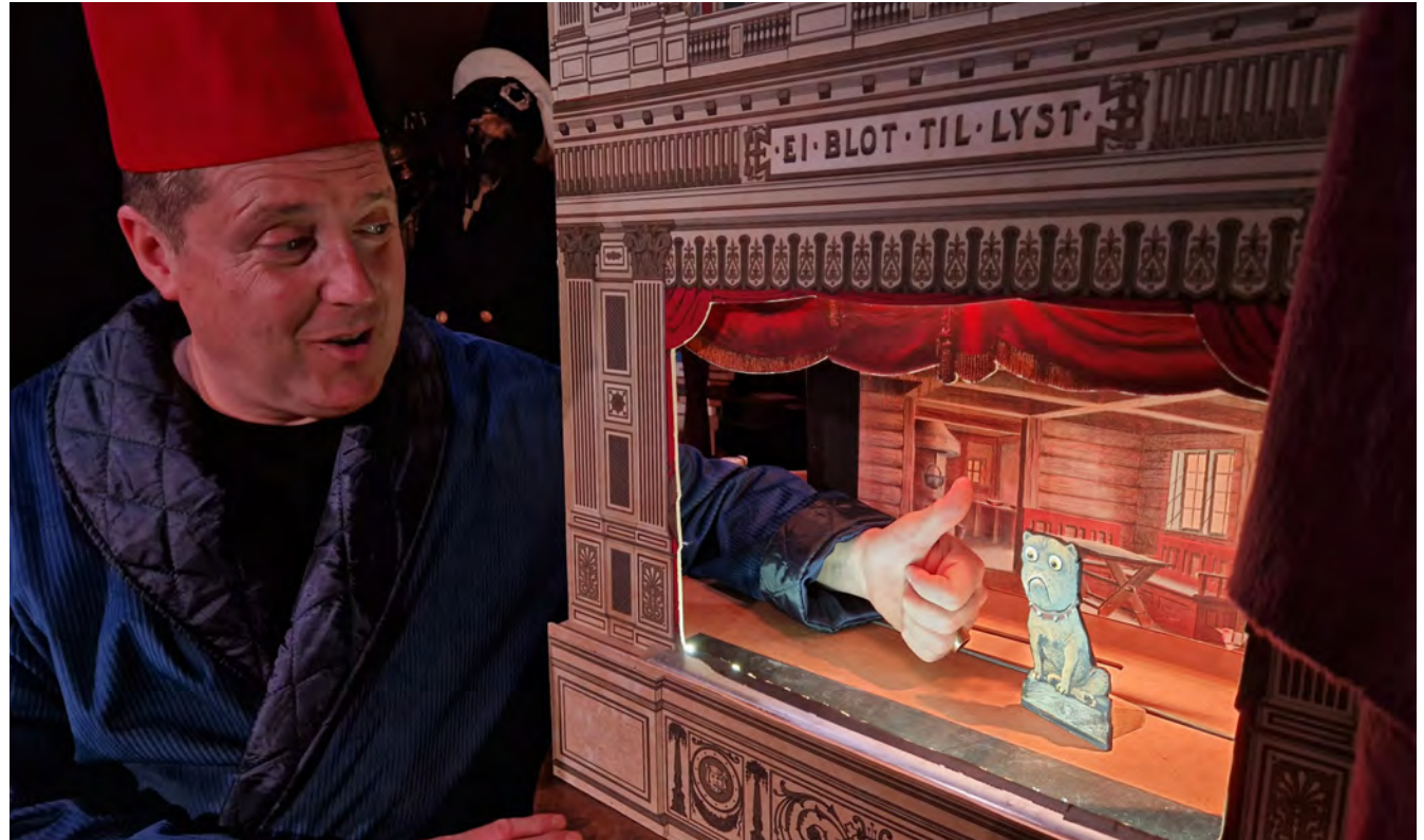
Scene fra “Teaternissens kuffert”.

I forbindelse med forestillingerne, der blev opført sent om eftermiddagen, var der arrangeret gratis fællesspisning i teatercafeen efter forestillingen – med risengrød til børnene og tomatssuppe til de voksne. Det var et meget vellykket arrangement, hvor publikum (børn og forældre/bedsteforældre) fik en hyggelig stund sammen med skuespilleren.