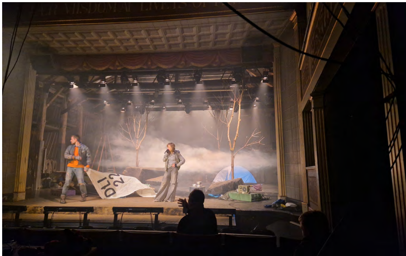
Prøve fra “Om lidt letter tågen”.

Den nye børneteaterordning er blevet omtalt tidligere i denne årsberetning, idet gæstespillet, Vai Via, og egenproduktionen, Teaternissens kuffert, også indgår som forestillinger i lys OP. Ordningen følger teatersæsonen og skoleåret 2025-26,