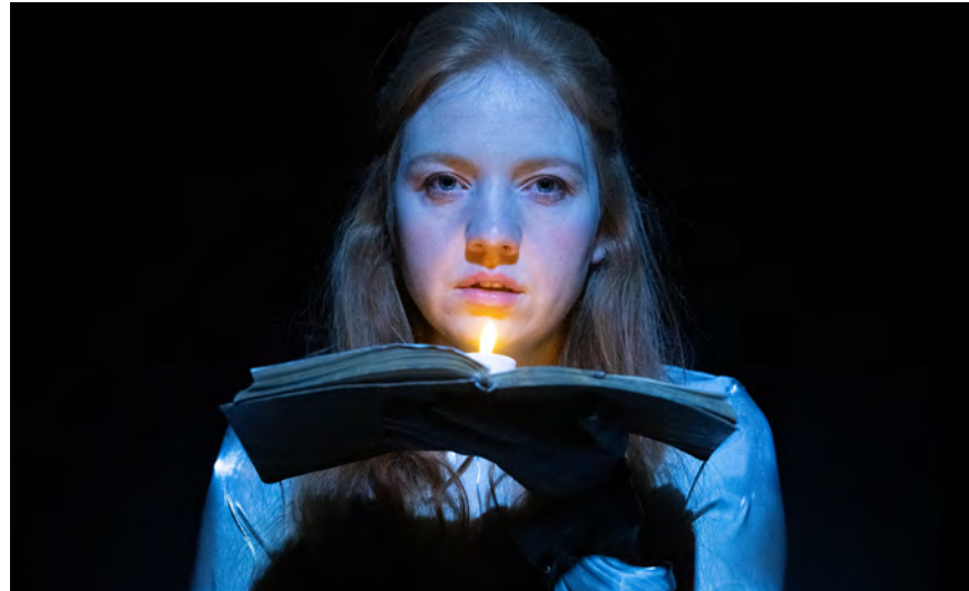
Scene fra "MAX" © Kim Caspersen, Bornholms Teater