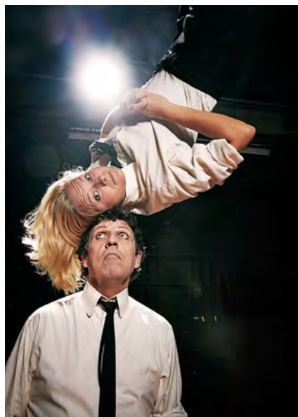
Scene fra “hallo!”.

“hallo!” var en meget poetisk, ordløs og akrobatisk forestilling – en forestilling som fangede alle.