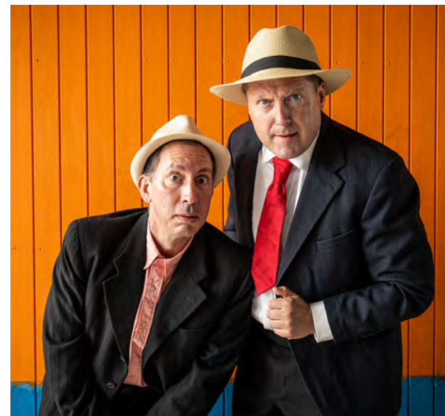
“Danish Clown”. © Anders Beier

Børneteaterforestillingen “Teaternissens kuffert” blev produceret i efteråret med premiere d. 14. november og spilleperiode frem til d. 5. december 2025. Derudover indgik forestillingen også i “lys OP”-ordningen.